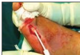
Aplicación de la matriz fluida Integra.