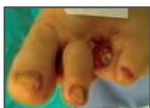
Diabetes Mellitus tipo I, gangrena úmida: 3° e 4° dedo esquerdo.