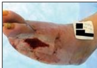
Seguimiento semana 2.