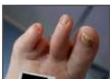
Acompanhamento semana 2.