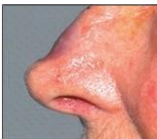
Acompanhamento semana 1