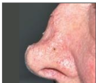
Cicatriz de Nariz