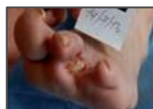
Acompanhamento semana 4.