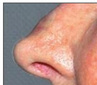
Acompanhamento semana 4