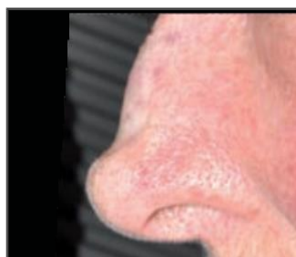
Aplicação de 1 seringa de matriz fluida Integra