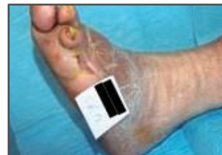
Cicatrización al mes