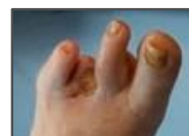
Cicatrização semana 6.