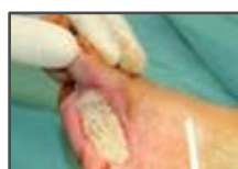
Aplicação da matriz fluida Integra