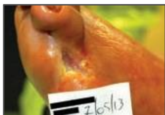
Deiscência cirúrgica depois de amputação: 4° e 5° dedo no pé diabético.